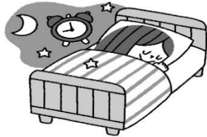
規則正しい生活で体調を整える