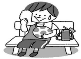
運動するときはこまめに休憩をとる