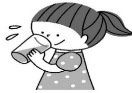
喉が渇く前にこまめに水分をとる